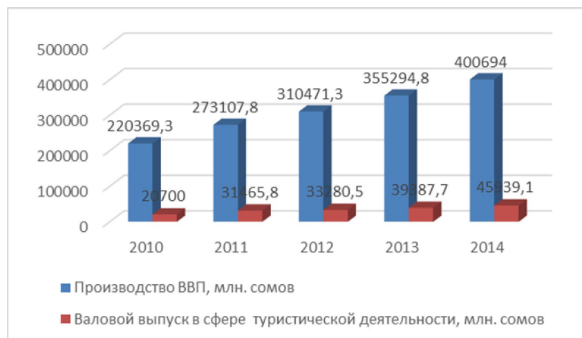
Рис. 1. Динамика ВВП в сфере туристической деятельности

Согласно исследованиям международных экспертов, Кыргызстан использует свой туристский потенциал не более чем на 15%, что объясняет низкий вклад туризма в экономику страны. Несмотря на рост отдельных показателей, доля сферы туризма в общем объеме ВВП республики, остается незначительной. Валовая добавленная стоимость, созданная в сфере туризма, в 2014г. составила 18904,9 млн. сомов. По данным Национального статистического комитета в 2014г. доля туризма в общем объеме ВВП Кыргызстана составил 4,8% в то время, как в 2010г. она составляла 3,7% [2].