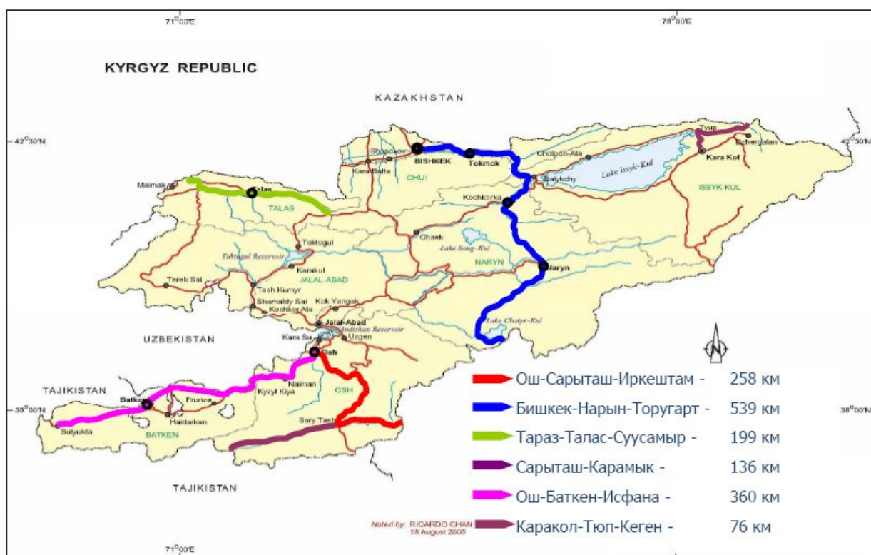
Рис. 1. Транспортные коридоры

Прогнозы грузопотоков через Кыргызскую Республику основываются на анализе тенденций в грузовых перевозках по транспортным коридорам Кыргызстана за последние 5 лет. Глобализация экономики и развитие внешних экономических связей требует новых подходов к развитию транспорта. Для этого необходимо анализировать и скрупулезно подсчитывать транспортные издержки маршрутов движения товарных потоков, проводить исследования взаимосвязи между развитием транспорта и ростом торговли, демографической динамикой и динамикой развития спроса и предложения, производства и потребителя, уделить внимание прогнозам политического развития стран и регионов большим транзитным потенциалом [1,2].