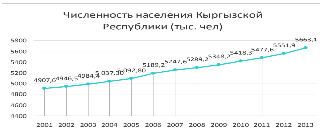
Рисунок 1. Изменение численности населения Кыргызской Республики, тыс.чел.

Распределение населения по полу в республике неоднородно. В городских поселениях доля женщин выше, чем мужчин и составляет 52,8%, а в сельской, где рождаемость выше, напротив, незначительно преобладают мужчины - 50,4%.