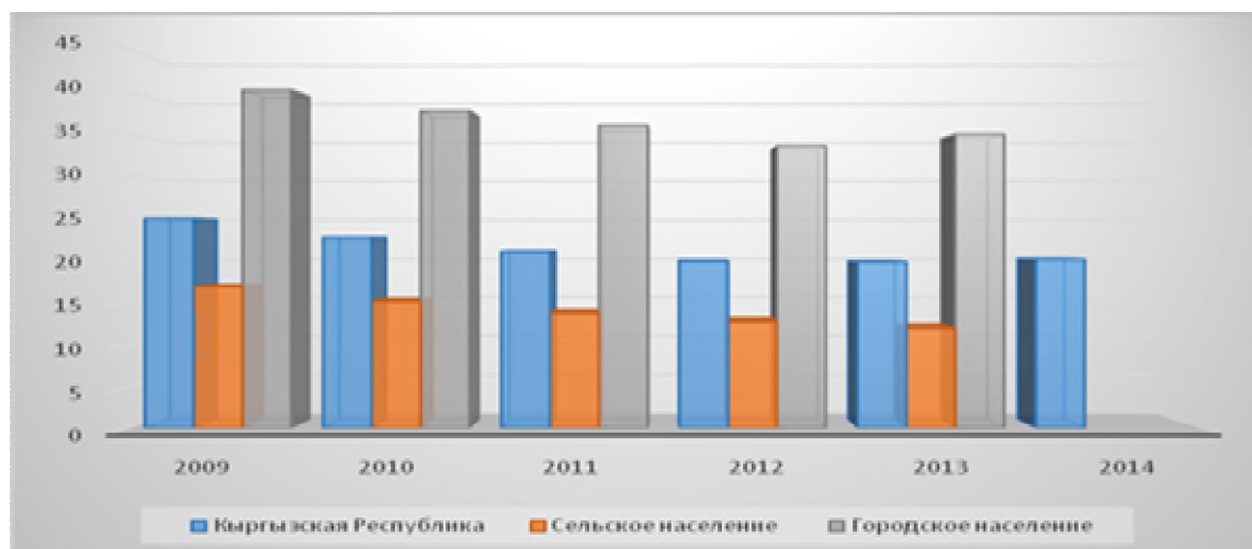
График 2. Уровень младенческой смертности в Кыргызской Республике.

Высокий уровень младенческой смертности в Кыргызстане обусловлен, прежде всего, низким социально-экономическим уровнем развития, слабым медицинским обслуживанием матери и ребенка, особенно в сельской местности.