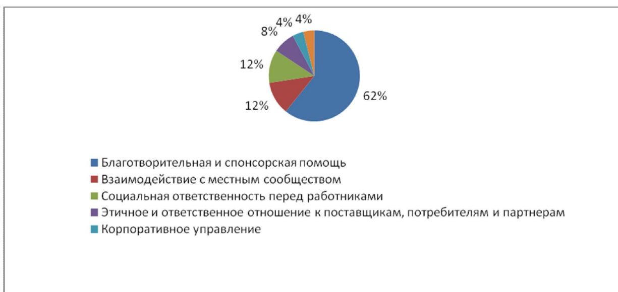
Рис 3. Основные направления проектов социальной ответственности бизнеса в Кыргызстане

Исходя из приведенных данных, возникает правомерный вопрос: как вовлечь в процесс КСО средний и малый бизнес. И здесь мнения экспертов расходятся. По нашему мнению, следует разграничить общественные ожидания по отношению к предпринимателям в зависимости от размера их бизнеса, поскольку практика взаимоотношений бизнеса и государства в социальной сфере даже в развитых странах простирается от "добровольно-принудительной" благотворительности и обычного торга до социального партнерства. При этом хорошо прослеживается связь между характером взаимодействия бизнеса, государственных органов и местного сообщества с одной стороны, и уровнем развития социальной ответственности предпринимателей - с другой. Что касается стран СНГ, и Кыргызстан - не исключение, то в них наибольшее распространение получили первые две модели взаимодействия 10 .