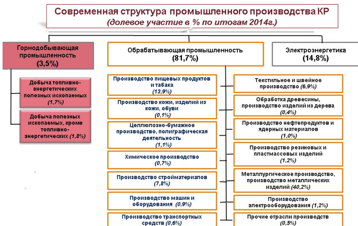
Рис.1. Современная структура промышленного производства КР

Современная структура промышленности включает в себя 17 отраслей. Из них две отрасли в горнодобывающей промышленности; 14 отраслей – в обрабатывающей промышленности и электроэнергетика - как отдельная отрасль промышленности. При этом, политика в сфере управления минеральными ресурсами передана Министерству экономики КР, а политика в сфере пищевой и перерабатывающей промышленности – Министерству сельского хозяйства и мелиорации КР (рис. 1). Производство горнодобывающей промышленности составляет 3,5% из всего промышленного производства страны. В отрасли занято 9200 человек, что составляет 0,4% от общего числа занятых в экономике. Доля предприятий в отрасли – 8%, всего 156 на 2014 год.