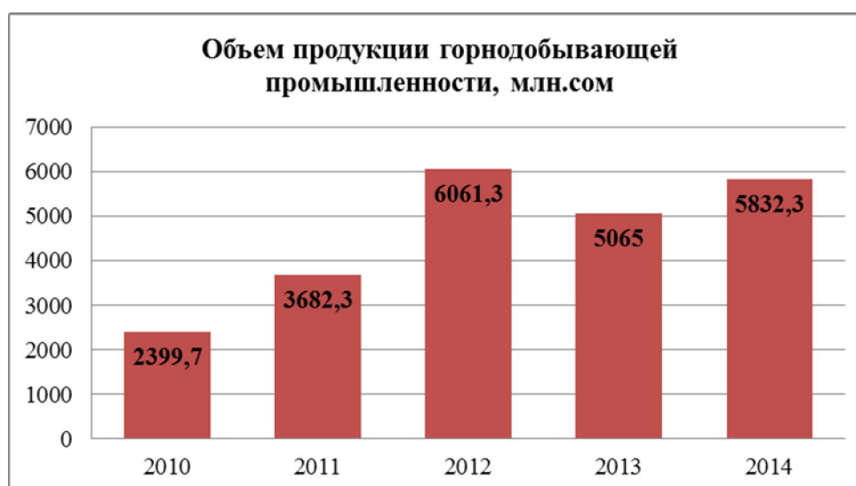
Диаграмма 1. Динамика объема продукции горнодобывающей промышленности

В последние годы в горнодобывающей отрасли Кыргызстана все чаще происходили конфликты. Возникали проблемы в процессе выдачи лицензий, некоторые вообще отказывались, происходила частая смена руководства в Министерстве геологии и минеральных ресурсов, недовольство местного населения, долгие разбирательства, связанные с золоторудным комбинатом «Кумтөр». Все это не могло не отразиться на отрасли в целом. Объем продукции горнорудной промышленности в 2014 году составил 5832,3 млн. сом (диагр. 1), что составило 99,22% от уровня производства 2012 года. В 2013 году темпы прироста объема производства горнодобывающей промышленности снизились на 16,44% по сравнению с предыдущим годом.