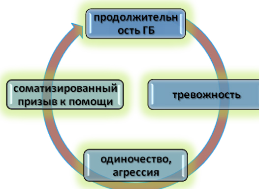
Рисунок 1 – Исследовательская модель

При психосоматических нарушениях эмоциональное напряжение определяется не изолированной эмоцией, а одновременным существованием противоречивых эмоций, например, тревоги и агрессии [5] (таблица 1). Причем, тревога в данном исследовании для всех выделенных групп респондентов достоверно отрицательно коррелирует со средним уровнем гетероагрессии, направленной на социальную среду (вербальная, физическая и эмоциональная агрессия) и достоверно положительно коррелирует с самоагрессией (аутоагрессией) высокого уровня (таблицы 1, 3).