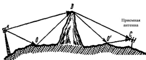
Рисунок 3 – Эффект усиления за счет препятствия

таких переизлучателей, расположенных в некотором объеме, способствует появлению рассеянных радиоволн.