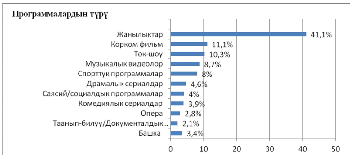
1-сүрөт. Кыргызстан боюнча телекөрүүчүлөр тарабынан эң көп жактырылган программалар.

Ушул эле көрсөткүч (2-сүрөт) Бишкек шаары боюнча көрүүчүлөр тарабынан эң көп жактырылган программалар деп табылган.