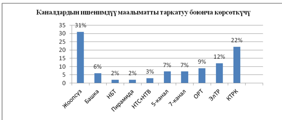
4-сүрөт. Ишенимдүү маалыматты таркаткан телеберүүлөр.

Ал эми кийинки таблицада изилдөөлөр боюнча ишенимдүү маалыматты таркаткан телеберүүлөрдүн салыштырмалуу көрсөткүчү берилди.