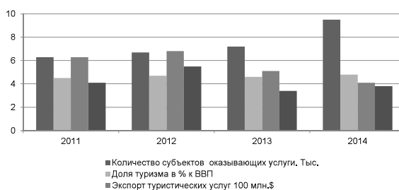
Рисунок 1 – Динамика основных показателей туристической деятельности в 2011–2014 гг.

Озеро Иссык-Куль, с великолепными пляжами, минеральными источниками, лечебной водой, грязевым и термоминеральным лечением, благодаря уникальному сочетанию горного и морского климата, является курортно-оздоровительной зоной мирового масштаба. Необходимо отметить, что в советский период Иссык-Куль имел статус «всесоюзной здравницы», где отдыхало в лучшие годы до 1,7 млн человек [2]. К сожалению, сегодня туристский потенциал КР задействован не в полной мере. В 2014 г. в целом по КР официально зарегистрировано 9,5 тыс. предприятий, осуществляющих экономическую деятельность в сфере рекреации и отдыха [3]. Динамика их роста в 2011–2014 гг. представлена на рисунке 1. Принято считать, что туризм считается профилирующей отраслью, если он создает более 8 % ВВП страны. Начиная с 2001 г., объявленного Годом туризма, туризм декларируется в КР как профилирующая отрасль экономики. Тем не менее, изначально и в последние 4 года его доля в ВВП страны колеблется от 3,4 до 4,8 %, что еще далеко от целевого показателя.