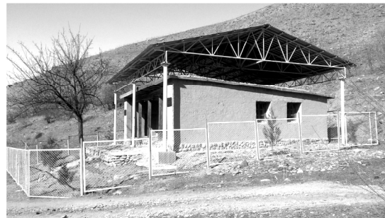
(Сүрөт №5, 2014.04.01)