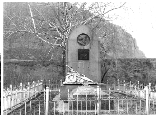
(Сүрөт №8, Токтогул Сатылгановдун мүрзөсү, 2014.04.02)