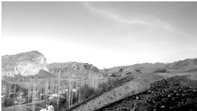
(Сүрөт №2 Чолпон-Ата айылы, 2014.04.01)