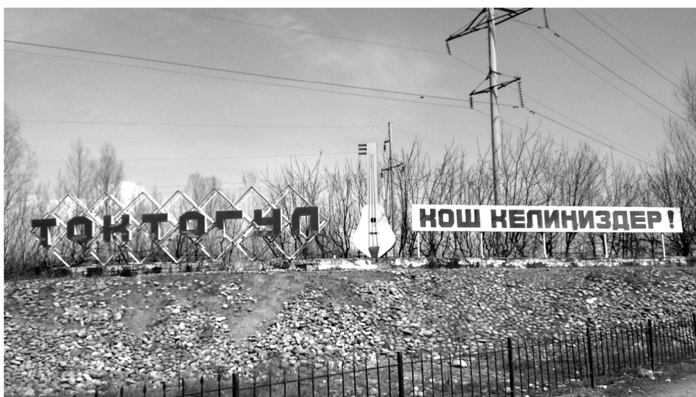
(Сүрөт №1, 2014.04.03)

Жыйынтыктап айтканда, Токтогул Сатылганов кыргыз элине калтырган мурасы өтө бай, жанрлыгы жагынан ар түрдүү, таанытычулук, эстетикалык, тарбиялык мааниси өтө зор. Токтогул Сатылганов эл арасында дагы деле, кадимки кечөөкүдөй эле, жашап келет.