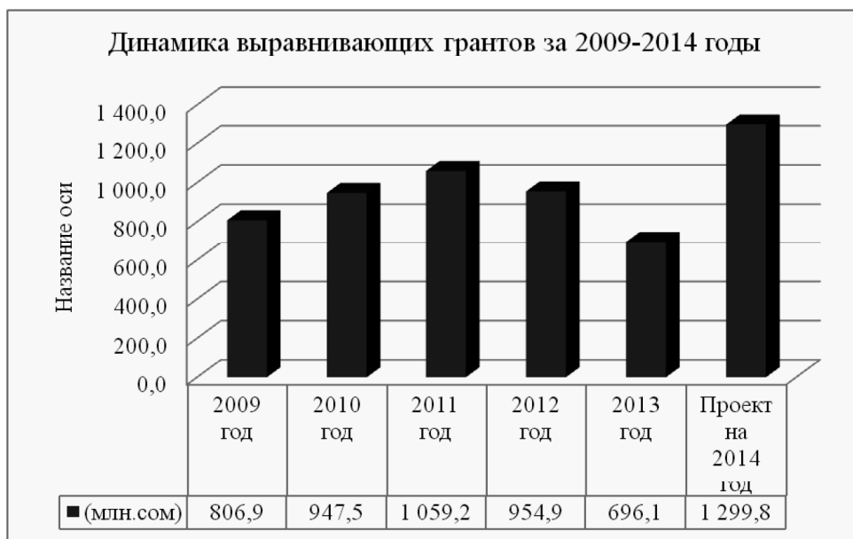
Рис. 2. Динамика выравнивающих грантов за 2009-2014 годы

Размеры выравнивающих грантов ежегодно определяются на основе математической формулы. Так, на 2014 год размер выравнивающего гранта составит 1299,8 млн. сомов, что по сравнению с в 2013 году (696,1 млн. сомов) больше на 603,7 млн. сомов. Динамика выравнивающих грантов за 2009-2014 годы показана на рисунке 2.