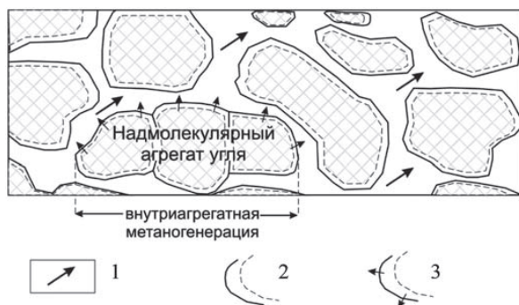
Рисунок 2 – Соотношение и связи твердой и жидкой фаз в агрегатном комплексе угля [2].

Органическое вещество угля обычно характеризуется сосуществованием различных конденсированных ароматических и алифатических структур, каждая из которых формирует зачастую довольно выраженные пакетные (кристаллитные) образования [1]. И, наконец, в углях широко представлены разнообразные органо-минеральные соединения, а также газообразная фаза (рисунок 2).