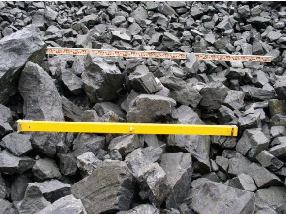
Рисунок 3 – Взорванная горная масса