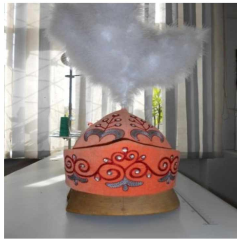
Рис. 2. а) Шөкүлө; б) Уку топу.

Для вышивок характерно ограниченное сочетание цветов. В вышивках применялись любимые кыргызские цвета – красный, пунцовый, синий, зеленый, а также белый и желтый. При подборе цветов для вышивания нами проявлялись большое чувство меры, отмечается художественный подбор гаммы цветов, строгая согласованность тонов.