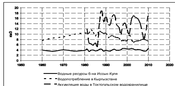
Рисунок 2 – Динамика структуры располагаемых водных ресурсов Кыргызстана

Связано это было с большими трудностями при разработке режимов эксплуатации водохранилища – с учетом противоречивых интересов Кыргызстана и Узбекистана. Для Кыргызстана использование Токтогульского водохранилища заключается, главным образом, в выработке электроэнергии в зимний период, а для Узбекистана – в подаче воды на нужды орошаемого земледелия в Ферганской долине в период вегетации. Отсутствие долгосрочных договоренностей между двумя суверенными государствами нередко приводило к тому, что для выработки необходимой энергии максимальные пуски производились в зимний период, тогда как в интересах ирригации больше всего воды требуется летом.