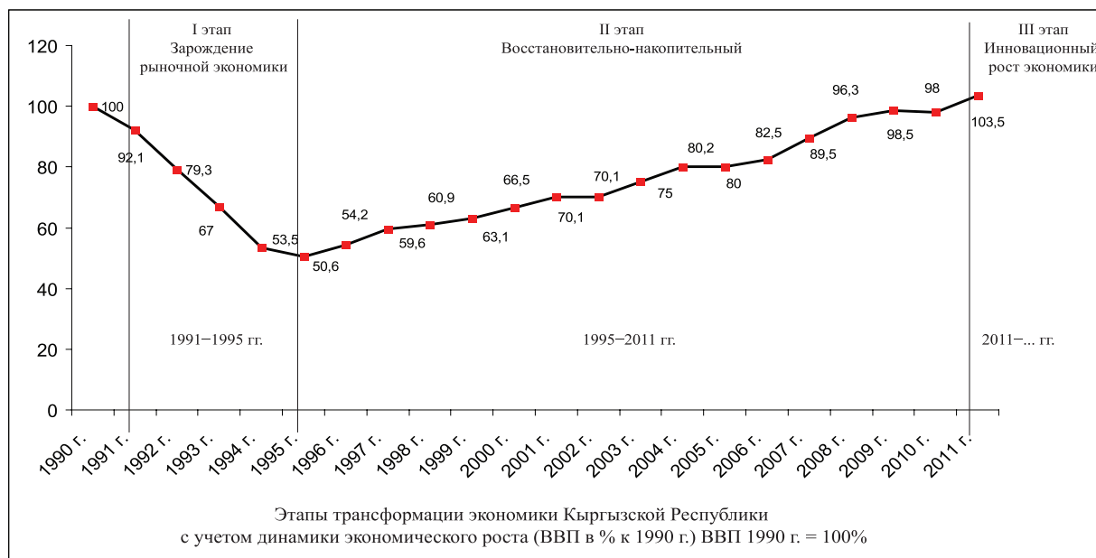
Рисунок 1 – Этапы трансформации экономики Кыргызской Республики с учетом динамики экономического роста (ВВП в % к 1990 г.)

С 1996 году в кыргызской экономике наметилось некоторое улучшение: темпы прироста ВВП в ре-