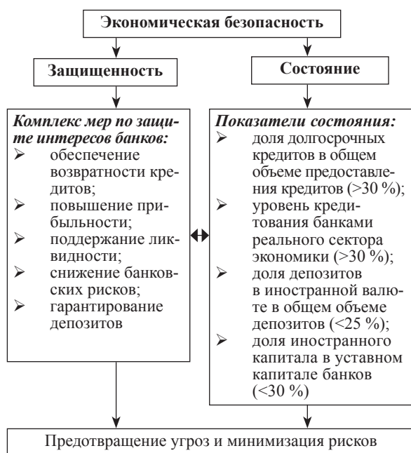
Рисунок 3 – Основные подходы к определению экономической безопасности банковской системы (разработка автора)

ленность, но приоритетной остается экономическая безопасность, являясь основой коллективной и личной безопасности в банковском секторе. Особую роль в таких условиях выполняют внешние и внутренние факторы риска, повышающие вероятность уровня экономической безопасности.