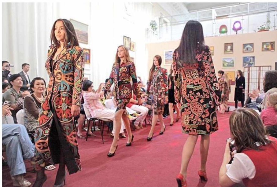
Сурет - 1

Ошондуктан биз изилдөө жүргүзүп, маанисине карап оюларды төмөнкү системага келтирдик: