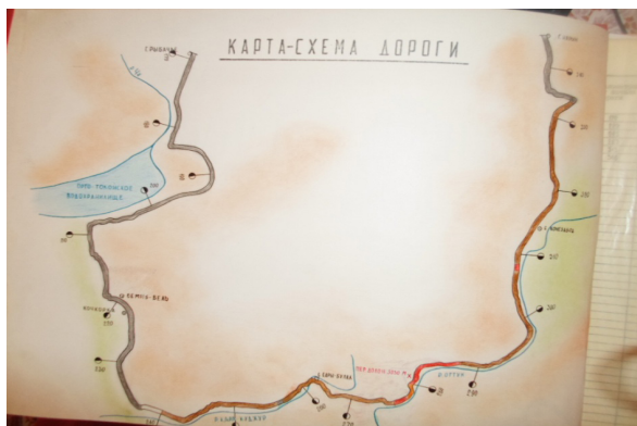
Рисунок 3 – Карта-схема дороги Рыбачье – Нарын

Следует отметить, что зависимость между аварийностью, средней скоростью потока и интенсивностью движения не постоянна и меняется с ростом его интенсивности. При малой интенсивности движения действия водителей определяются только восприятием ими дорожных условий.