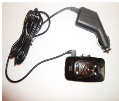
Рисунок 1 – Видеорегистратор GS8000 с устройством GPS

зали, что различное качество дороги отражается и на относительном количестве ДТП [2]. При свободных условиях движения (уровень удобства А) на опрокидывание приходится 79,5 %, на столкновение – 5,3 % происшествий от общего количества ДТП, а при большей интенсивности (уровень удобства Б) на опрокидывание приходится 20,1 %, на столкновение – 48,8 %.