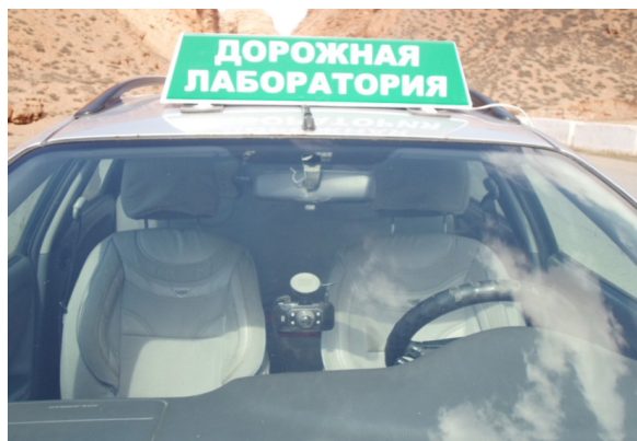
Рисунок 2 – Автомобиль оснащенный видеорегистратором GS8000 с устройством GPS

Объектом нашего исследования был выбран 312 км (рисунок 4) а/д Бишкек – Нарын – Торугарт, где за три года зарегистрированы 9 ДТП, причинами которых было превышение скорости, установленной ПДД, дорожными знаками и выезд на полосу встречного движения, нарушение правил обгона.