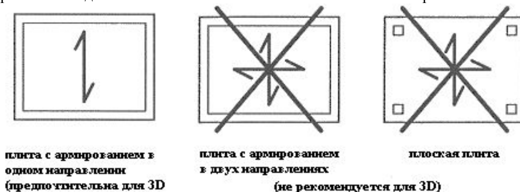
Рис.2. Типы плит

В системе ТСК как правило применяются армированные в одном направлении плиты, поэтому в поперечном направлении панели ТСК могут поглощать только небольшие растягивающие, сдвигающие усилия и, поэтому небольшие моменты сил (рис.2). Плиты ТСК с армированием в одном направлении могут рассчитываться в случае их непрерывного соединения как сплошные балки с постоянным поперечным сечением.