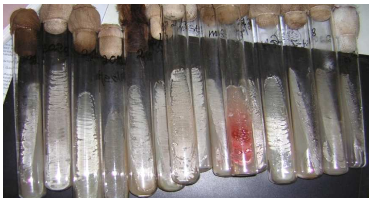
Рис. 1. Протестированные штаммы рода Streptomyces на разных с/х культурах.