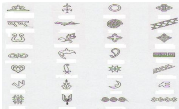
Рис. 2. Наиболее часто встречающиеся узоры

Использовались в декоре зигзаги, штрихи, полосы, «елочный» орнамент, плетеночный («веревочный») узор. Древний человек наделял определенными знаками свои представления об устройстве мира. Например, круг — солнце, квадрат — земля, треугольник — горы, свастика — движение солнца, спираль — развитие, движение и т. д. Но они, по всей вероятности, еще не обладали для предметов декоративными качествами (часто покрывались орнаментом скрытые от глаз человека части предметов — днища, оборотные стороны украшений, оберегов, амулетов и др.). Постепенно эти знаки-символы приобрели орнаментальную выразительность узора, (Рис. 2.) который стал рассматриваться только как эстетическая ценность. Цель орнамента определилась — украшать.