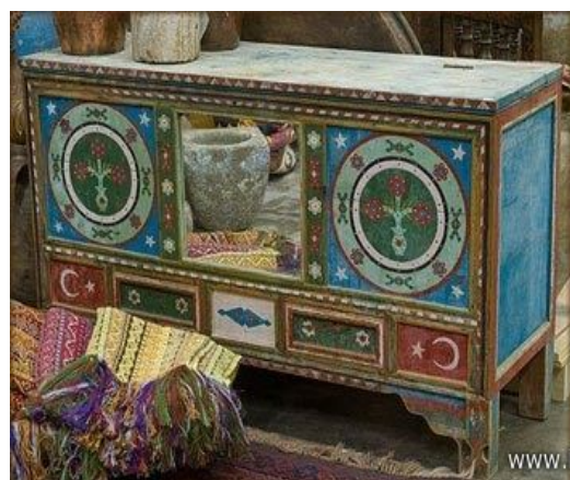
Рис. 4. Национальный орнамент в интерьере