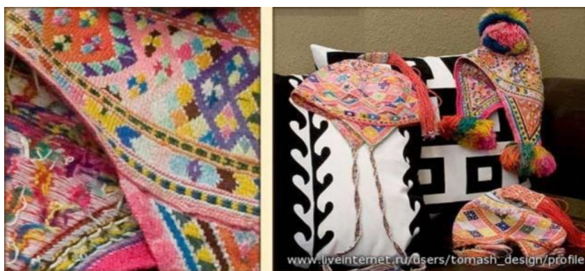
Рис. 3. Ручное ткачество (терме боо)

ковроткачества. Более распространены у кыргызов войлочные ковры, а также различные бытовые предметы из орнаментированного войлока. Для орнаментации войлока применяются три технических приема. Первый прием — это вкатывание в основной фон войлока узоров из цветной шерсти. Такого типа ковры называют ала кийиз. Второй прием— аппликация: на войлочную основу нашивают узор из окрашенного войлока или из ткани. Наконец, третий прием состоит в сшивании вместе элементов одного узора, вырезанных одновременно из двух разных по цвету кусков войлока. Ковры, изготовленные таким способом, называют шырдак. Кроме ковров, из орнаментированного войлока изготавливают мешки и сумки для хранения и перевозки утвари, принадлежности сбруи и т. п. /2/.