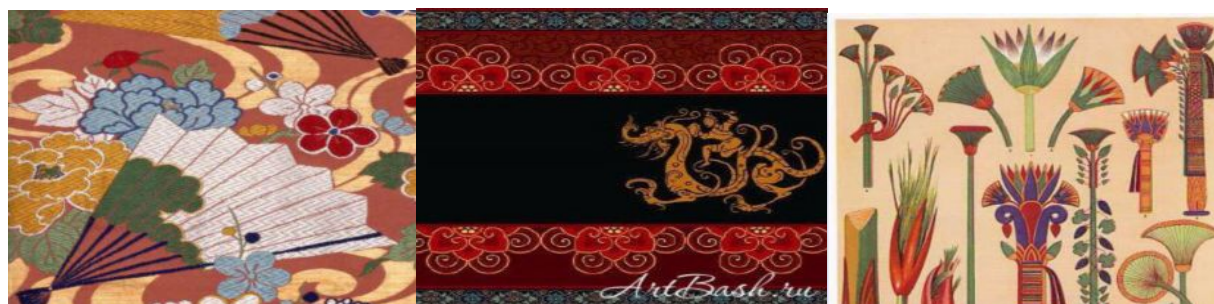
Рис.1. Национальные орнаменты разных наций

Орнамент — латинское слово, а в переводе на русский язык означает «украшение», «узор», построенный на ритмическом чередовании и сочетании геометрических или изобразительных элементов. Являясь основой народного искусства, он во многом определяет традиции этноса. Каждая эпоха, каждая нация выработала свою систему орнамента (Рис. 1.) По ней можно определить и время, и страну, где был создан тот или иной предмет /7/.