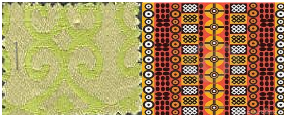
Рис. 5. Национальный орнамент на ткани

пряжи основы и утка в полотне ткани. Специфическая выразительность ткацкого узора обеспечивается использованием переплетений разных структур, сочетанием нитей разного волокнистого состава, и применением пряжи гладкой, фасонной, меланжевой и пр. (Рис. 5.).