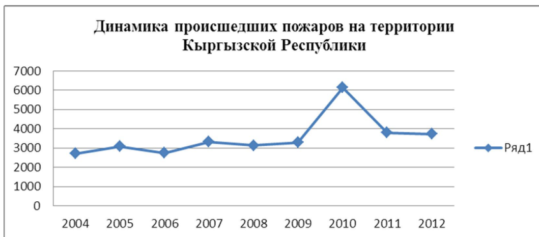
Рис. 1. Динамика происшедших пожаров на территории Кыргызской Республики

В 2012 году основными причинами пожаров являлись (Рис. 2.): неосторожное обращение с огнем (36 %); несоблюдение правил эксплуатации электроприборов и оборудования (32,5 %); шалость детей с огнем (10 %); несоблюдение правил эксплуатации печей (8,6 %) и т.д. /1/. За 9 месяцев 2013 года по республике произошли 2824 пожара, ущерб от которых составил более 227 млн. сомов, на пожарах погибли 44 человека, из них 5 детей.