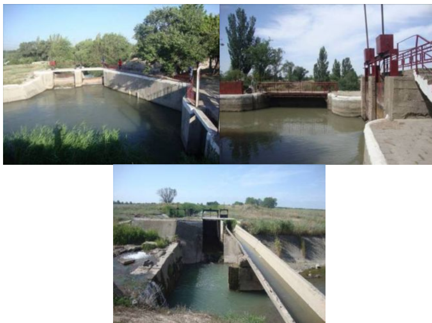
Рисунок 3 – Георгиевская ИС

Для определения потенциальных дефектов проведена георадарная съемка вышеуказанных ГТС и каналов (рисунки 5, 6).