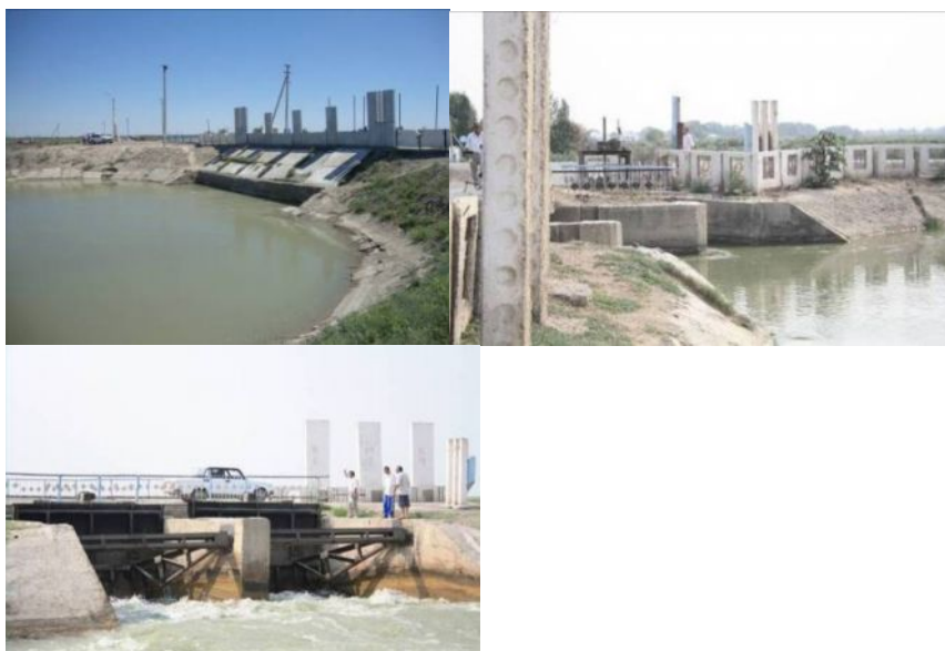
Рисунок 2 – Жанакорганская ИС

- на Георгиевской ИС (рисунок 3), 18 сооружений Правой (тройник-вододелитель (ПК-42 МК), головной гидрост (ПК-4), Р-112 (ПК-103), Р-116 (ПК-125), дюкер (ПК-256), Р-118 (ПК-153), акведук (ПК-253)) илевой ветки (Р-4(ПК-157), Калгутинский (ПК-204), Р-6 (ПК-228), Р-8 (ПК-253), Р-10 (ПК-322), Р-14 (ПК-384), Р-16 (ПК-431), Р-16 бетонный (ПК-450), дюкер (ПК-487), Р-18 (ПК-10 бетонный канал), Р-20 (ПК-95)); каналы Правой ветки на длине 3,5 км.