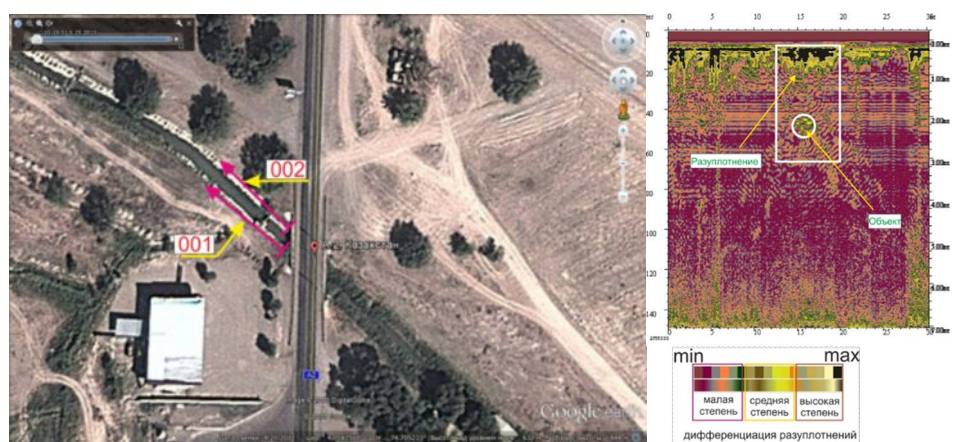
Рисунок 6 – Гидроузел Р-112 Правой ветки Георгиевской ИС

Профиль № 002 левый берег головного водозаборного сооружения Жанакорганской ИС: на глубину до 0,7 м на длине от 0 до 32 м от водозабора отмечаются разуплотнения средней и малой степени; на расстоянии от 0 до 12 м разуплотнение