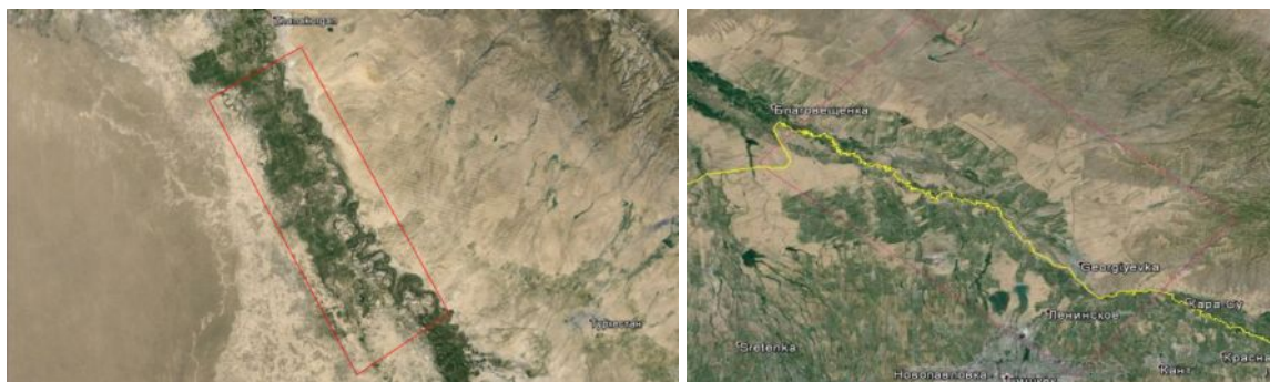
Рисунок 1 - Обзорные космические снимки Жанакорганской и Георгиевской ИС

растительностью, значительными потерями воды на фильтрацию, изменением режима и условий эксплуатации. Влияние этих факторов приводит к снижению пропускной способности (иногда в несколько раз) канала, отклонению основных параметров живого сечения канала (глубины, ширины) от проектных значений, увеличению потерь воды на фильтрацию, значительному уменьшению КПД каналов, отказам в их работе, заключающихся в прорывах дамб, разрушении плит одежд, затоплении и подтоплении прилегающих к каналам территорий.