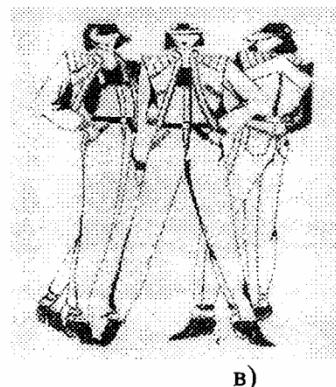
Рис. 2. Многофигурная

Выполнение графических работ на учебных занятиях рекомендуется начинать с простейшего решения - черно-белого (рис. 1). Это помогает начинающим получить представление о том, как одним черным цветом (тоном), можно на белой бумаге выразить содержание замысла. Возможности такой графики достаточно большие. Обучающиеся по одной постановке должны сделать несколько вариантов, по-разному используя линию и пятно. Одну и ту же постановку следует поочередно решать, используя сначала только линии, затем только пятна, а в конце показать широкие возможности линейно-пятнового решения (рис. 2). В каждом случае, решая художественную задачу, обучающиеся должны обращать внимание на орнаментальность линии и пятна, на возможности и особенности графических средств. Познавая различные приемы графики, будущий специалист постигает возможности выражения образности замысла порой самыми скупыми средствами. Наряду с этим педагог знакомит с различными техническими приемами графики.