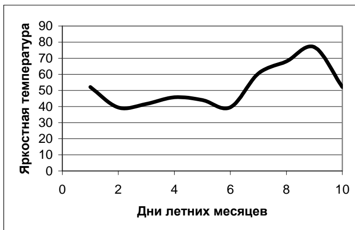
Рис. 1. Внутрисезонные изменения Tя облачной атмосферы Бишкека (лето).

Для исследования внутрисезонных вариаций излучения облачной атмосферы была произведена выборка данных расчета по трем типам облаков – Ac, Sc и Ci. При этом, результаты расчетов излучения были для каждого сезона представлены в хронологическом порядке. Например, для лета – это первые дни с облачностью одного из трех типов в июне месяце, затем в июле и августе. Для зимних месяцев – это декабрь, январь и февраль. По Бишкеку выборка дала десять дней с облачностью указанных типов, из них 4 дня в июне, 3 дня в июле и 3 дня в августе. В качестве внутрисезонного хода изменений излучения облачности в виде непрерывной линии представлен на рис. 1.