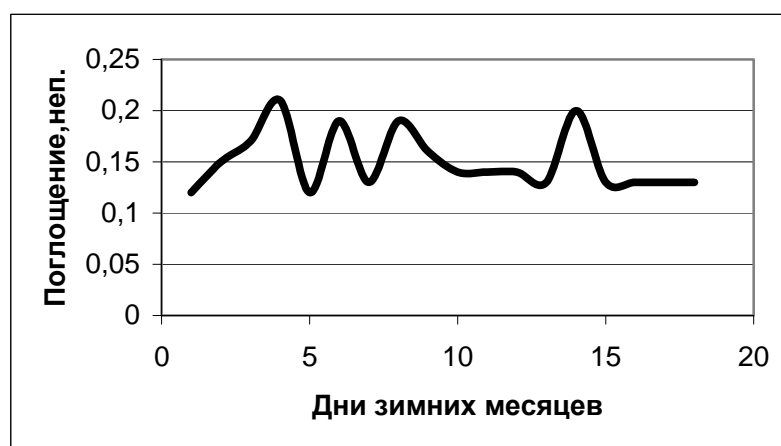
Рис 4. Внутрисезонные изменения поглощения атмосферы Бишкека (зима).

Как уже было отмечено, исследование излучения и поглощения облачной атмосферы Северного Кыргызстана были представлены в отчетах и обсуждались в научных изданиях [5,6].