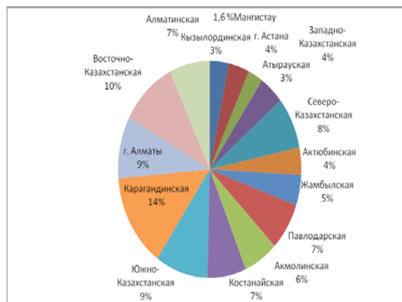
Рисунок 1 – Экстенсивные показатели заболеваемости злокачественными опухолями глаза и его придаточного аппарата в Республике Казахстан по регионам

выявлено, что самый высокий уровень был зарегистрирован в Павлодарской области – 0,9 на 100 тыс. населения, что в четыре с лишним раза было выше, чем в среднем по республике.