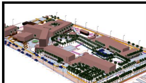
Рис. 6. Трехмерная модель территории КГУСТА