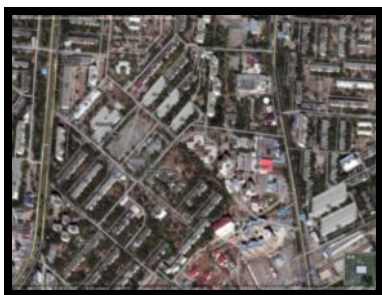
Рис. 2. Космическое изображение г. Бишкек, совмещенное с топографической основой (фрагмент)

• Третья уникальная функция космических изображений заключается в том, что космический снимок представляет собой, по существу, фотопортрет территории. Архитектор-проектировщик получает возможность воочию, в натуре, увидеть предмет своей деятельности (город, район, область), что дает совершенно уникальный эффект, не сравнимый с изучением картографических материалов. Дело в том, что при составлении карт в результате генерализации многие, не существенные на взгляд картографа, детали пропадают, что обедняет общую картину территории.