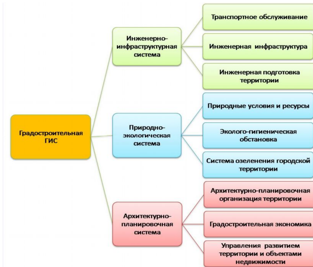
Рис. 7. ГИС-система в градостроительном планировании

Каждая из указанных систем содержит определенное количество тем, каждая из которых, в свою очередь, состоит из значительного числа тематических картографических слоев с более или менее обширной семантической базой данных. Например, архитектурно-планировочная организация территории содержит следующие темы: