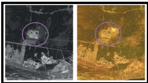
Рис. 5. Разновременные космические изображения с указанием произошедших изменений.