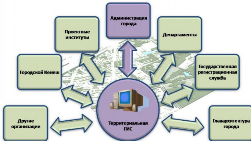
Рис. 1. Используемые и взаимодополняющие структуры для создания градостроительной ГИС

Результатом такой работы становится создание полноценной градостроительной геоинформационной системы, которая вполне может рассматриваться как ядро территориальной ГИС, поскольку градостроительная документация содержит в себе именно комплексное осмысление территории (рис. 1).