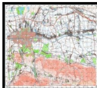
Рис. 4. Топографическая карта г. Бишкек масштаба 1: 100 000