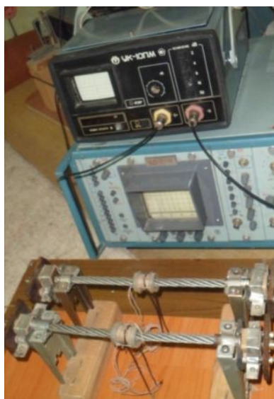
а) общий вид стенда

Разработанный стенд позволяет провести экспериментальные исследования по оценке изменения сечения стального каната в процессе эксплуатации, определить дефекты в месте крепления стального каната к прицепному устройству, разработать устройство непрерывного контроля за режимом работы и конструктивной целостности стальных канатов на подъемных установках барабанного типа и лифтов со шкивами трения.