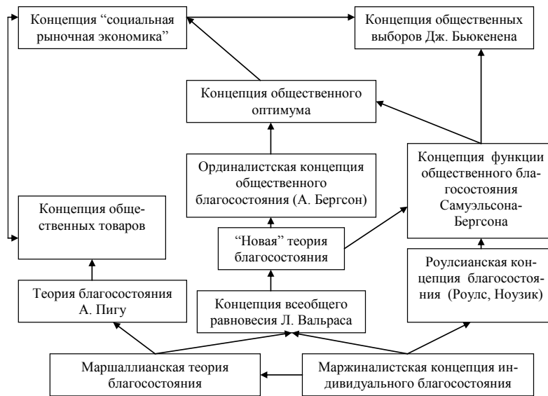
Рисунок 1 – Эволюция теорий благосостояния [4] 1

многих индивидов ограничены. В этой связи индивидуальное благосостояние – это субъективная оценка уровня реализованных потребностей и возможностей, сформированная в процессе участия человека в воспроизводстве материальных благ и услуг в существующих условиях.