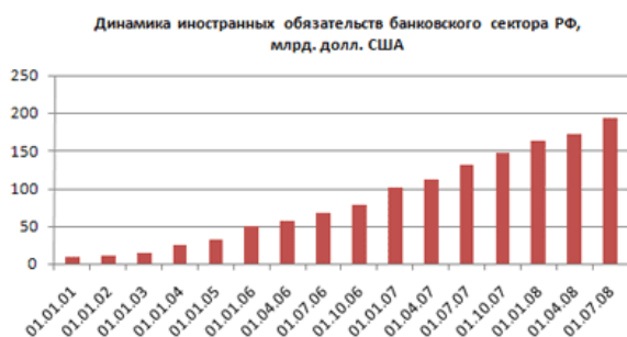
Рисунок 2 – Иностранные обязательства

о “перегреве” финансового рынка. Во-первых, массовая продажа российских акций зарубежными владельцами вызвала панику и четырехкратный обвал фондовых рынков России. Во-вторых, ухудшились условия кредитования российских банков, предприятий и организаций со стороны международных инвесторов. Это наложило на наличие большого негосударственного внешнего долга предприятий и организаций России. По данным ЦБ РФ, российский внешний долг по состоянию на 1 июля 2008 г. составил 527 млрд. долл. США, включая 39 млрд. долл. государственного долга. Большая часть внешнего долга состоит из обязательств российских корпораций и банков. Величина иностранных обязательств банковского сектора во II квартале 2008 г. в 4 раза превысила тот же показатель 2005 г. (рисунок 2).