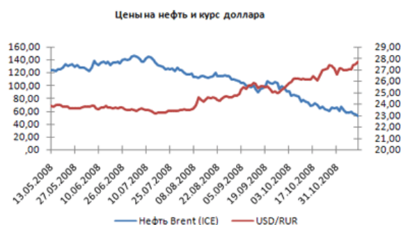
Рисунок 3 – Цены на нефть и курс доллара

Ослабление рубля стало реальностью, несмотря на усилия ЦБ РФ по поддержанию национальной валюты. За октябрь 2008 г. ЦБ РФ потратил более 100 млрд долл. на поддержание курса рубля. Однако тенденция к ослаблению рубля продолжилась, подкрепляемая действиями населения по конвертации рублевых сбережений в валютные.