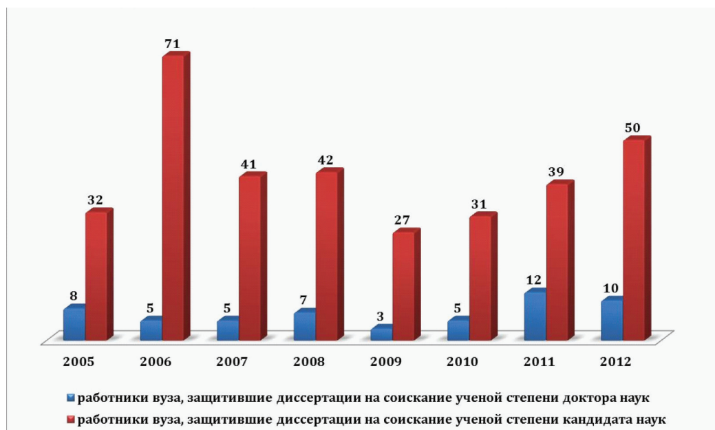
Рисунок 1 – Защита диссертаций (работники вуза)

Работают диссертационные советы по приоритетным научным направлениям: 7 из них открыты ВАК Российской Федерации, 6 – ВАК Кыргызской Республики, из них 10 по защите докторских и 3 кандидатских диссертаций. В советах вуза защищено 69 докторских и 588 кандидатских диссертаций, работниками университета защищено 82 докторских и 430 кандидатских диссертаций (рисунок 1).