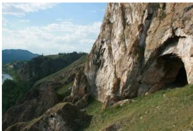
Пещера Тогыз-Ас на берегу реки Ак-Юс.