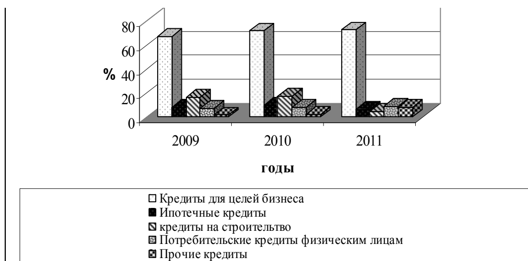
Рис. 1. Структура кредитных вложений в экономику

Кредиты на строительство в 2011 году составляли 2155,6 млн сомов, что в 0,33 раза меньше, чем в 2009 году. Кредиты на строительство уменьшились на 4339,3 млн сомов (2155,6-6494,9), или на 33,18 % по сравнению с 2009 годом. По сравнению с 2010 годом кредиты на строительство в 2011 году снизились на 4908,5 млн сомов, или на 30,51 %.