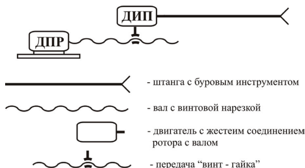
Рисунок 3 – Схема привода ВПМ с отдельным приводом вращения и подачи инструмента

Первый двигатель ДВ обеспечивает вращение рабочего инструмента. Второй двигатель ДП обеспечивает как вращение, так и подачу за счет связи двигателя с валом передачей типа “винт – гайка”. За счет одновременного управления двигателем обеспечиваются как рабочие, в широком диапазоне, так и аварийные режимы работы инструмента за счет создания такой системой “электромеханического дифференциала”.