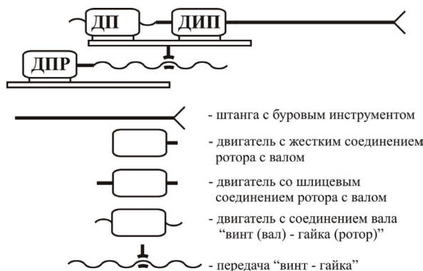
Рисунок 4 – Схема привода ВПМ, позволяющего применять элементы интеллекта в управлении

Минимальная конфигурация бурового агрегата вращательного бурения с элементами интеллекта достигается жесткой механической связью выходных валов обеих схем приводов – идентификационного и рабочего (рисунок 4).