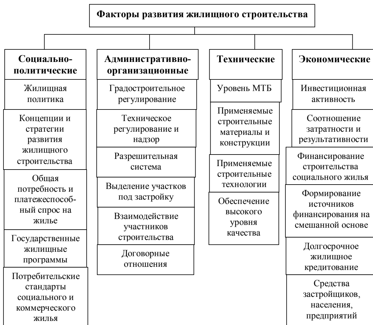
Рис.2. Условия и факторы, оказывающие влияние на развитие жилищного строительства