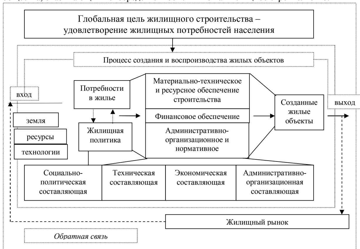
Рис. 1. Жилищное строительство с точки зрения системного подхода

объектов), определяющих дальнейшее развитие системы. Любая система действует в определенной внешней среде, оказывающей влияние на саму систему, параметры ее входа и выхода. К факторам внешней среды дальнего окружения относится совокупность экономических, политических, правовых и прочих факторов хозяйственной сферы общества, оказывающих непосредственное влияние на жилищное строительство.