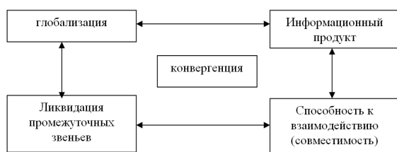
Рисунок 3 – Взаимодействие информационных тенденций

Внедрение новейших информационных технологий создает удобную и доступную для пользователей информационную среду, способствующую ликвидации промежуточных звеньев и взаимодействию на основе совместимости информационных стандартов. Обстоятельства для транспортной логистики имеют большое научно-практическое значение (рисунок 3).