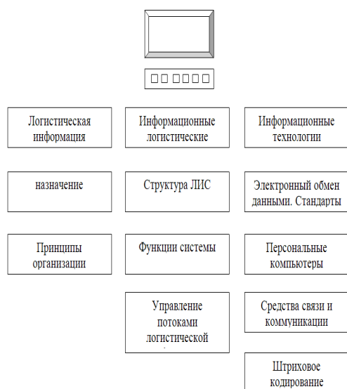
Рисунок 1 – Информационные ресурсы интегрированной логистики

материального потока. Все более насущной становится проблема непрерывного учета результатов функционирования системы, что способствует оперативному внесению изменений, как в построение, так и реализацию хода интегрированного процесса “поставка – транспортировка”.